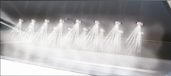
Secondo processo pulizia a vapore. / Second process: steam cleaning.