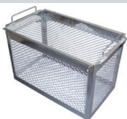
Accessori disponibili: gancettiera e cestello. Available accessories: basket and rack.