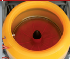
Nuova vasca Turbo HIGH SPEED 3D. New Turbo tank HIGH SPEED 3D. Neuer Turbo Behälters HIGH SPEED 3D. Nouvelle Cuve turbo HIGH SPEED 3D.

Est une machine pratique et rapide pour le tonnelage de pièces en microfusion, estampage et quincaillerie métallique.