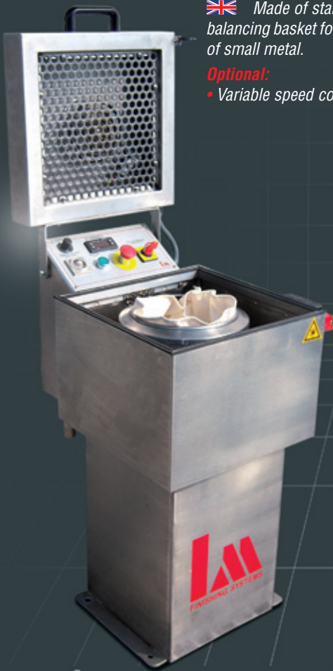
Cestello in acciaio inox. Stainless steel basket.