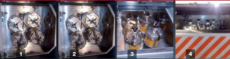
1 Posizione 120 gradi. 120° position. Position 120 Grad. Position 120°.

ITALIANO | ENGLISH | DEUTSCH | FRANÇAISE