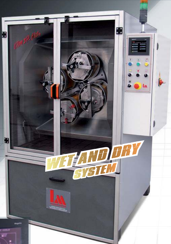
4 Posizione orizzontale. Horizontal position. Horizontale Position. Position horizontale.