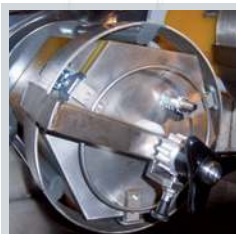
Nuovo sistema di chiusura. New close system. Neues Schließsystem. Nouveau système de fermeture.