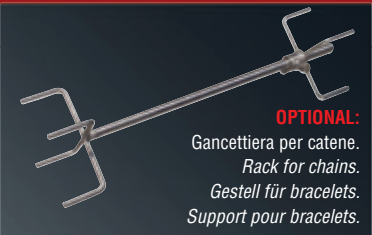
OPTIONAL: Gancettiera per catene. Rack for chains. Gestell für bracelets. Support pour bracelets.