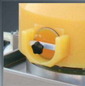
MOD. 50 lt.

Vibratore circolare in acciaio Inox. Circular vibrator Stainless Steel. Zirkular-Vibrator aus rostfreiem Stahl. Vibrateur circulaire en acier Inox.