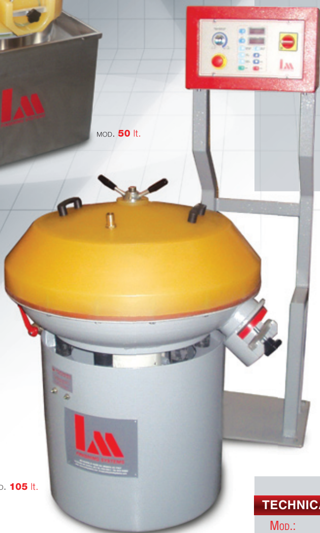
MOD. 105 lt.