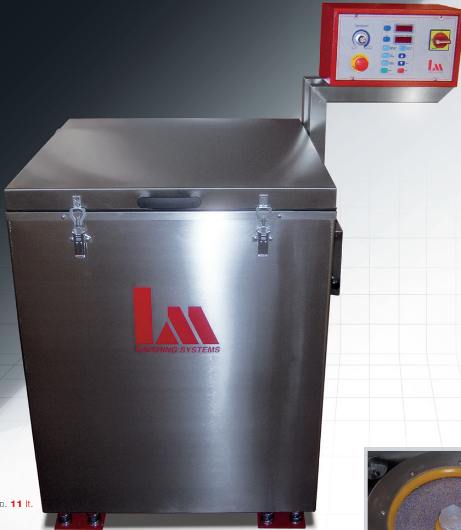
MOD. 11 lt.

Tutte le nostre apparecchiature sono marcate CE All ours equipments are marked CE