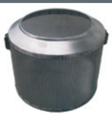
Cestello in acciaio inox. Stainless steel basket.